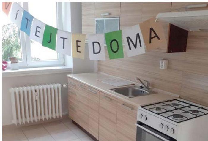
BYTY PRO RODINY S DĚTMI. Byty do projektu zajistila společnost Heimstaden Czech a Spolek PORTAVITA.

Úkolem našeho projektu je poskytnout cílové skupině samoživitelů, popř. rodinám s dětmi, skutečný trvalý domov, tedy nikoliv jen dočasné bydlení, a zároveň jim po celou dobu nabízet využívání služeb Spolku PORTAVITA při řešení různých obtížných situací, ve kterých si neví rady. Naše podpora začíná již ve chvíli, kdy je rodina vybrána do projektu, tzn. ještě před jejím samotným zabydlením a dále pokračuje po dobu asi dvou let, kdy je projekt realizován. Rodinám nabízíme pomoc s praktickým vybavením a technickými záležitostmi bytu, poskytujeme poradenství ve věci vyřízení financí potřebných pro pravidelné hrazení nájmu a služeb a dále pak pracujeme s jejich individuálními zakázkami. Může jít o pomoc s vedením domácnosti, řešení různých rodinných situací nebo emoční podporu v těžkém období. Také učíme nájemníky, jak vycházet se sousedy apod. Obecně lze říci, že každá