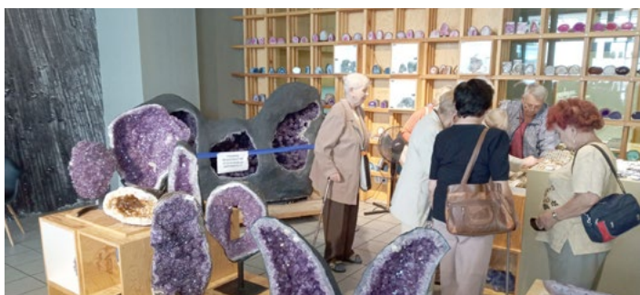
rukodělné výrobky. Senioři na letošním zájezdě poznali výrobu svíček nebo opracování drahých kamenů.

prahových zařízení pro děti a mládež z Havířova, Ostravy, Frýdku-Místku, Orlové a Kopřivnice. Turnaj pořádala Armáda spásy ve spolupráci se Spolkem PORTAVITA. Zápasy se hrály ve dvou věkových kategoriích do 13 let a do 17 let. Mezi mladšími zvítězili domácí hráči z havířovského klubu Bumerang, mezi staršími pak trofej vybojovali mládežníci z Klubu Prostor Frýdek-Místek.