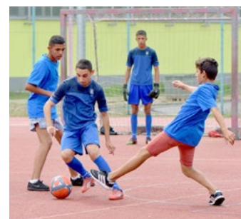
LÍTY BOJ O ZLATÝ MÍČ. Týmy z nízkoprahových zařízení se o trofej bili jako lvi. Nakonec zvítězili domácí hoši z klubu Bumerang a mládežníci z Klubu Prostor Frýdek-Místek.