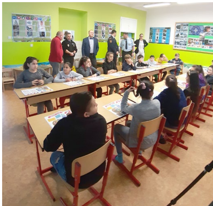
NOVÁ A MODERNÍ. V učebně primární prevence a projektové výuky budou žáci spolupracovat s odborníky z řad policie, hasičů a dalších.