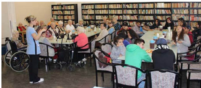
DVĚ GENERACE SPOLU. Děti z Bumerangu a senioři z Luny prožili odpovědně plně soutěží.

V polovině měsíce března se v Domově seniorů Luna nacházejícím se v městské části Šumbarak konal pátý ročník Sportovních her dvou generací. Akce se zúčastnili senioři ze střediska Luna a devatenáct dětí z Nizkoprahového zařízení pro děti a mládež Bumerang Armády spásy.