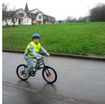
VIDĚT A BÝT VIDĚN! ... je důležitou součástí dopravní výchovy, kterou děti ze ZŠ Školní skvěle ovládají.

A co všechno děláme? Učíme se dopravní značky a dopravní předpisy, řešíme křižovatky. Při výuce dopravní výchovy využíváme interaktivní tabule, dopravní testy řešíme na počítačích. Vyrábíme plánky a modely okolí školy, hledáme nejbezpečnější cestu