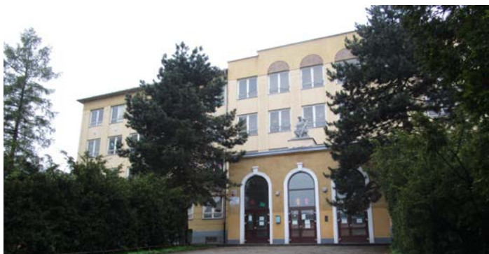
ŠKOLNÍ BUDOVA ŠKOLNÍ. Základní školu na ulici Školní v Havířově Šumbarku navštěvuje přes 170 dětí.