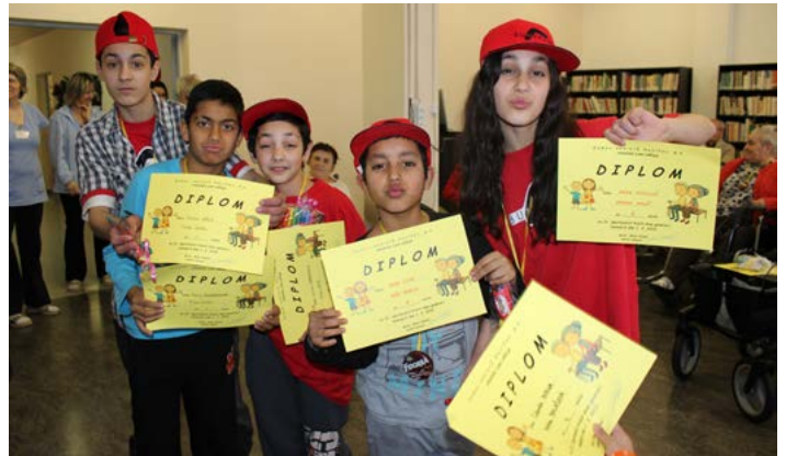
BUMERANG DĚTI BAVÍ. Prostředí, kde se děti a mladí lidé mohou cítit bezpečně. To je Bumerang.

Hlavně si zde ale děti mohou hrát. Mají tady k dispozici různé deskové hry, počítač, stolní fotbal, ping-pongový stůl anebo několik hudebních nástrojů. „Hodně populární je tady tanec. Někteří hoši a děvčata zde tančují téměř denně, zkoušejí breakdance a podobně