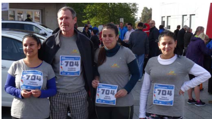
ODVÁŽNÁ ČTYŘKA. Závodníci ze Šumbaráku se postavili na start Havířovské desítky. I když neměli příliš natrénováno, akci si užili.

Přes pět stovek nadšených sportovců, stovky fanoušků na hlavním havířovském náměstí, nový traťový rekord a padesát tisíc korun pro místní boccisty. To je účet druhého ročníku Havířovské desítky, která o třetím říjnovém víkendu oživila centrum nejmladšího města naší republiky. Partnerem závodu se stala také Šumbarák. Do závodu štafet přihlásil své družstvo, na start se postavil také tým PORTAVITA.