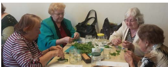
NAUČNÉ ODPOLEDNE. Komunitní místnost na náměstí žije, na akcích Šumbaráku a Portavity bývá plno.