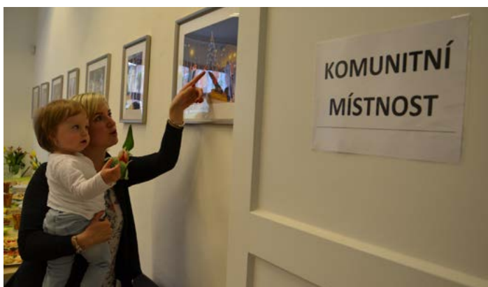
OTEVŘENO. Na slavnostní otevření nových prostor, které poskytla společnost RPG Byty, přišli i zástupci města.

vědomost a motivace. „Vzhledem k tomu, že v sociální nouzi žijí celé generace rodin, je jasné, že bez něčí pomoci zvenčí si ani nedokážou představit, že změna je možná. I proto s těmito lidmi pracujeme přímo v jejich domovech. Nyní můžeme práci rozšířit o motivační a vzdělávací kurzy, které lidem usnadní návrat na trh práce. Plánujeme také zprostředkovat místním lidem kouče, kteří jim s motivací pomohou. Jednoho nám poskytne také společnost RPG Byty zdarma, což určitě využijeme. Jedním z dlouhodobých cílů je i zvýšení finanční gramotnosti sociálně slabých obyvatel, se kterými spolupracujeme.“ dodává.