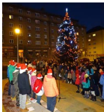
NÁMĚSTÍ OŽILO. Rozsvěcování vánočního stromu přilákalo na náměstí stovky obyvatel starého Šumbarku.