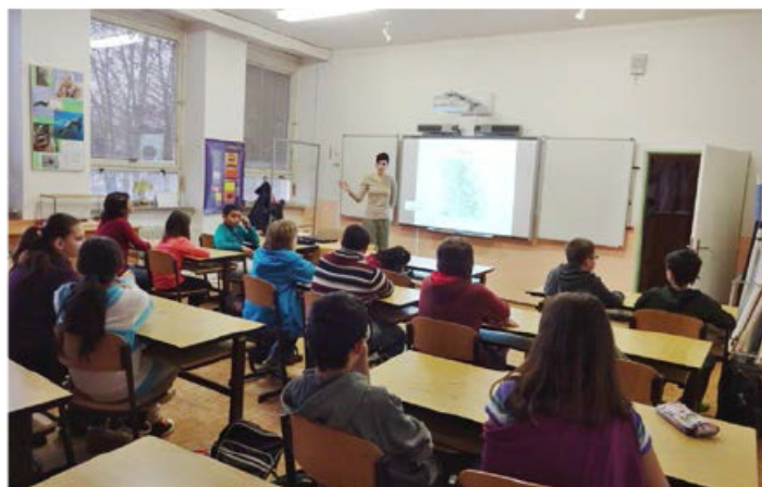
HODINA ZEMĚPISU. Děti poslouchaly přednášku celou hodinu, pak měly spoustu otázek.