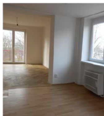
2+1, Jarošova 764, 2. patro, 49 m 2 , 3970 Kč/měs