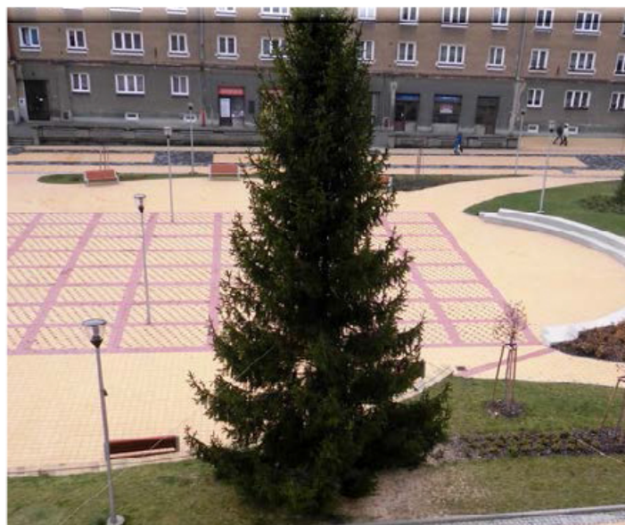
INSTALACE. Paní Jana Vaněčková zachytila instalaci historicky prvního vánočního stromu na starém Šumbarku a fotky nám zaslala. Děkujeme.

Kdo si chce užít atmosféru vánočních trhů, musí za ní do centra města. Vánoční městečko na náměstí Republiky zahájilo provoz v pátek 28. listopadu. Až do pondělí 22. prosince tady zažijete bohatý kulturní program. Denně na děti čekají výtvarné skleněné stánky, různé pohádky, komponované pořady s koledami či divadelní představení. Havířovští si mohou 10. prosince na náměstí Republiky v rámci celorepublikové akce Česko zpívá koledy společně zazpívat nebo mohou v pátek 12. prosince odpoledne hromadně vypustit balonky Ježíškovi. Také letos se na náměstí Republiky koná „půlnoční mše“. V deset večer ji na Štědrý den organizuje pod širým nebem Církev bratrská. (pie)