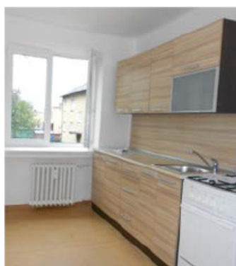
2+1, Okružní 1079/16, přízemí, 54 m 2 , 4170 Kč/měs