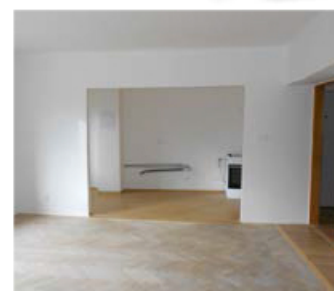
3+1, Dukelská 631/6b, přízemí, 68 m 2 , 5100 Kč/měs

Volejte makléřku Jiřinu Kočí. Tel.: +420 840 114 115