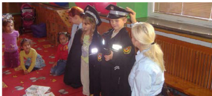
MALÍ STRÁŽNÍCI. Uniforma jim sice byla velká, ale to na zážitku nic neměnilo.