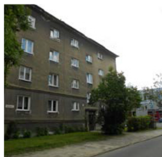
2 + 1, Smetanova 887/7, 1. patro, 53 m 2 , 4170,- /měsíc