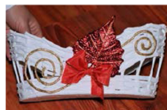
VÝROBKY. Na jarmarku si můžete koupit košíky, které vyrábějí děti i učitelé. Výtěžek půjde na podporu psího útulku v Heřmanicích.

Každý, kdo si na jarmarku něco koupí, dostane pohlednici, s motivy Šumbaráku, kterou vyrobilo sdružení Šumbarák z fotografií, které zhotovily děti ze ZŠ Jarošova (pie)