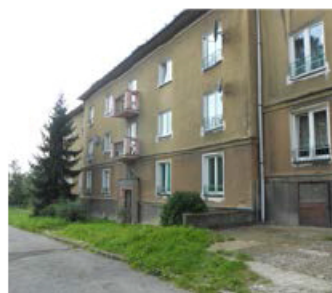
2 + 1, Jarošova 858/21, 2. patro, 54 m 2 , 4670,- /měsíc