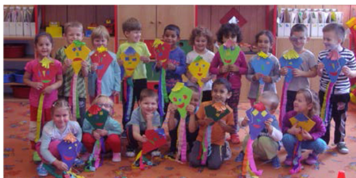
DRAKIÁDA. Kluci a holky si vyrobili své vlastní draky. Patří to k podzimu i k dětství.

K podzimu patří také draci. Rovnou tučet draků na provázku se zapojilo s dětmi do zábavného sportovního klání a společně s úsměvnými zážitky si děti odnesly sladkou odměnu s diplomem. (min, pie)