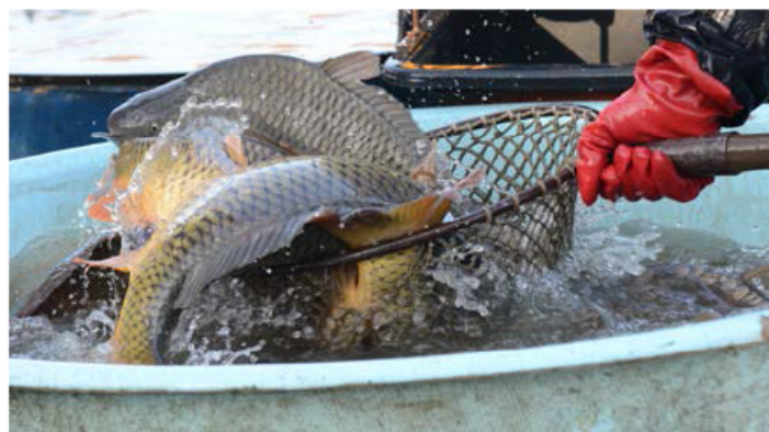
KAPŘI PŘÍMO Z RYBNÍKU. Máte-li rádi ryby, přijďte v listopadu na výlov rybníku.

Od 1. prosince bude v Šenově zahájen vánoční prodej ryb, a to denně od 9 do 16 hodin. Více se dozvíte na www.prodejrybsenov.cz . (pie)