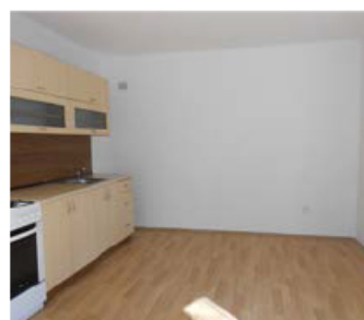
2+1, Anglická 779, přízemí, 49 m 2 , 3900 Kč/měs