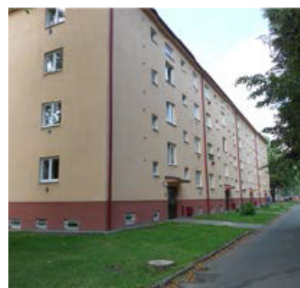
2+1, Jarošova 783/0, 2. patro, 48 m 2 , 3600 Kč/měs