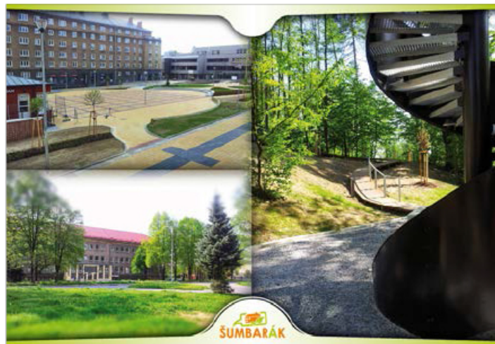
FOTO: VÝBĚR Z VÝSTAVY

Pět fotografií, které pořídili místní obyvatelé, se stanou součástí prvních pohlednic Šumbarku. Fotografie vytvořili v rámci soutěže o nejhezčí fotku Šumbarku. Celkem se do soutěže přihlásilo asi 30 sou-