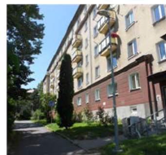
2+1, Okružní 818/1, přízemí, 60 m 2 , 4670 Kč/měs