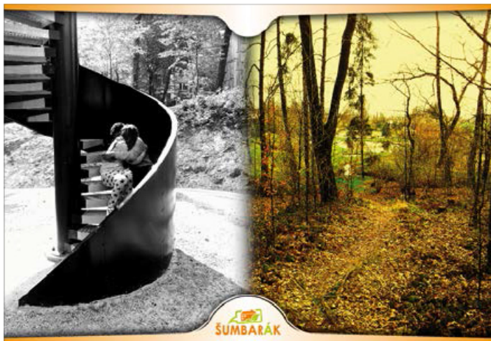
POZDRAV ZE ŠUMBARKU. Takto vypadají nové pohlednice Šumbarku. Autory jsou sami místní obyvatelé.