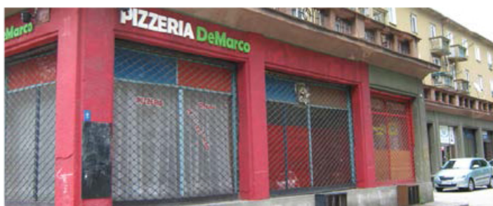
Obchodní prostory, 143m 2