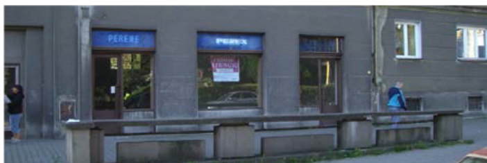
Obchodní prostory, 131m 2