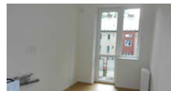
3 + 1, Dukelská 625/8b, 1. patro, 70 m 2 , 4300,- /měsíc

Volejte makléřku Jiřinu Kočí. Tel.: +420 840 114 115