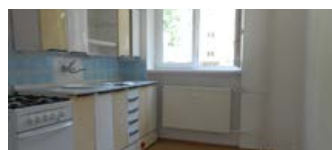
2 + 1, Jarošova 839/14, přízemí, 54 m 2 , 4000,- /měsíc