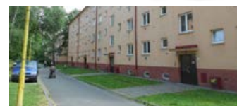
2 + 1, Jarošova 775, 2. patro, 48 m 2 , 3770,- /měsíc