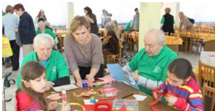
DVĚ GENERACE. Děti ze Šumbarku přišly udělat radost důchodcům z domova Luna.

Děti i pracovníci Armády spásy děkují personálu Domu seniorů Luna za moc dobrou organizaci a nápad. (pie, nov)