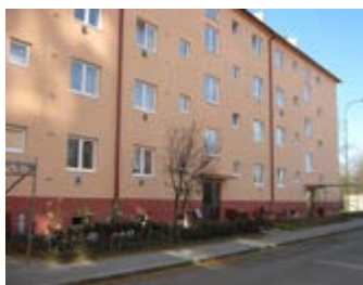
2 + 1, Obránců míru 791, 1.patro 49.02 m 2 , Po slevě: 2900,- /měsíc