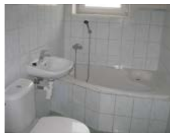
2 + 1, Anglická 763, 3.patro 61.01 m 2 , 3770,- /měsíc