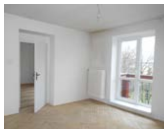
2 + 1, Wolkerova 715/2, 3.patro 4450,- /měsíc, 61.01 m 2