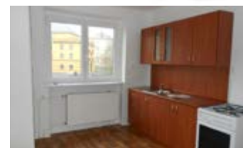
2 + 1, Obránců míru 620/1, 2. patro 51.37 m 2 , 3750,- /měsíc