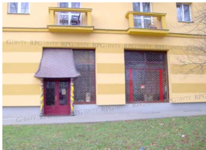
110m 2 , ulice Slovenského národního povstání 805/2

V případě zájmu volejte na tel.: 840 114 115