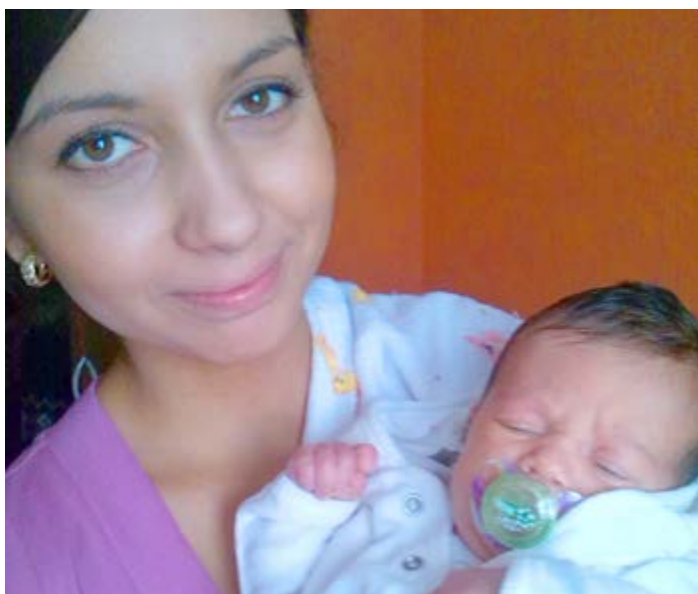
NOVÝ PŘÍRŮSTEK. První v roce 2014 na Šumbarku.