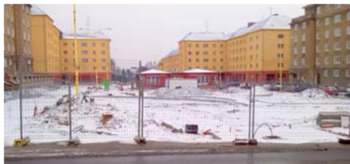
VE VÝSTAVBĚ. Na konci května se můžeme těšit na nové náměstí T. G. Masaryka

jme se se synem na televizi. Pak přišla dcera s dětmi a manželem. Na Šumbarku je krásné bydlení, je tu ticho. Chtěla bych poděkovat hlavně panu Fabíkovi. Je to velice obětavý člověk. Přijede, když je potřeba, snaží se vše vyřešit a pomoci. Má vždycky dobrou náladu. (pebo)